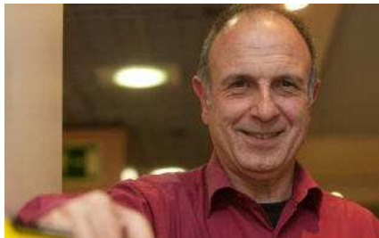
'Estar en nuestra zona de confort sólo sirve para repetir lo conocido'

Hay una necesidad de acompañamiento en el cambio y en la comunicación. El coaching está cubriendo ese agujero. En Estados Unidos hay coaching para todo, uno que sale mucho es el de pareja, el de cargos de responsabilidad... El coach les ayuda a reflexionar en esa "soledad del líder", aunque nunca le dará la solución. Todo sale de ti.